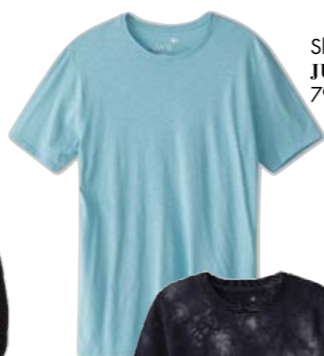
Shirt JUVIA 79.90