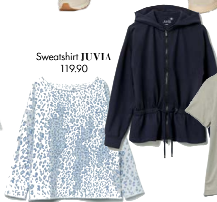
Sweatshirt JUVIA 119.90