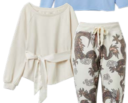
Sweatshirt JUVIA 129.90