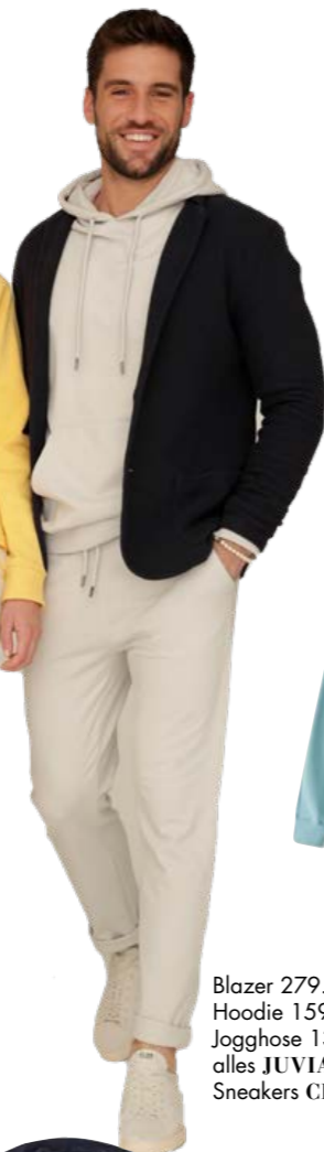
Blazer 279.90, Hoodie 159.90, Jogghose 139.90, alles JUVIA Sneakers CLAE 149.90