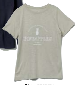
Shirt JUVIA 79.90