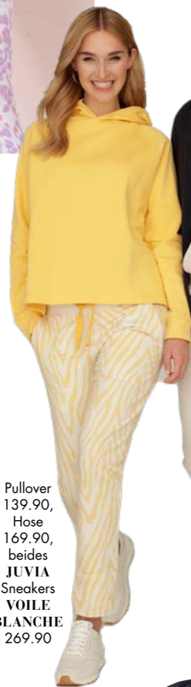
Pullover 139.90, Hose 169.90, beides JUVIA Sneakers VOILE BLANCHE 269.90