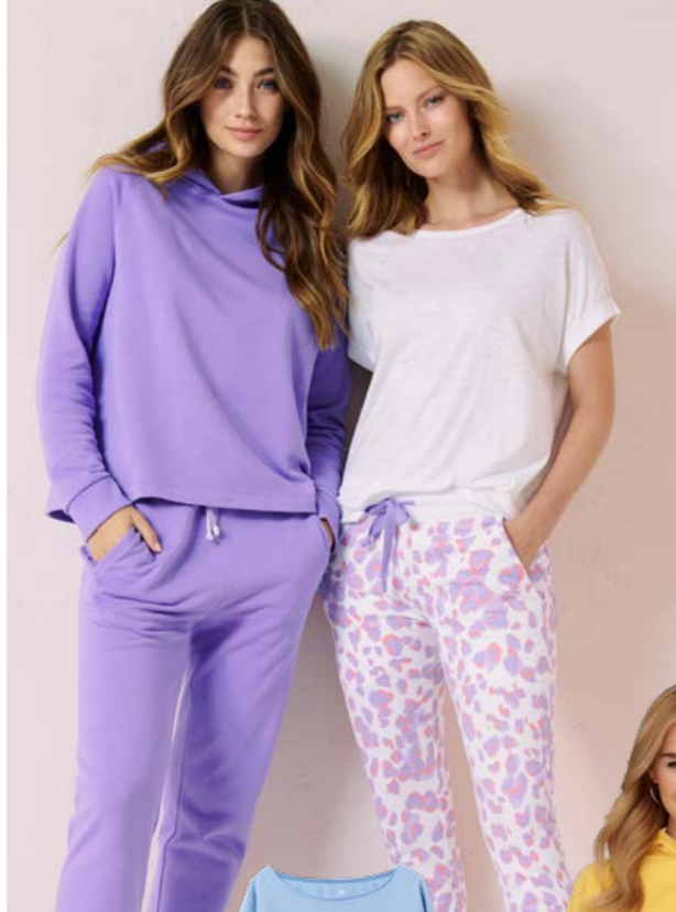
Sweatshirt JUVIA 119.90

Kreieren Sie Ihre persönliche COMFORT LOUNGE: Von Espresso über Toffee bis hin zu HONIGGELB UND MEERBLAU – Farbnuancen aus der Natur geben in der kommenden Sommersaison den Ton an.