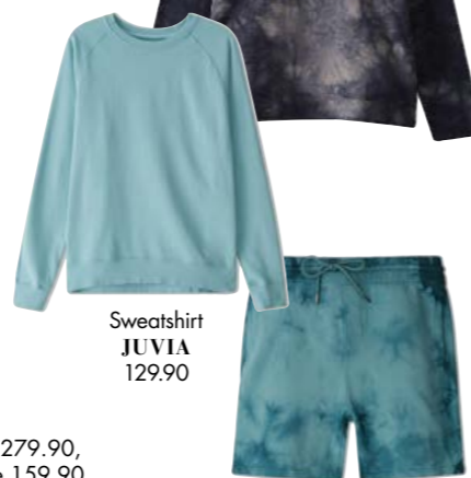
Sweatshirt JUVIA 129.90