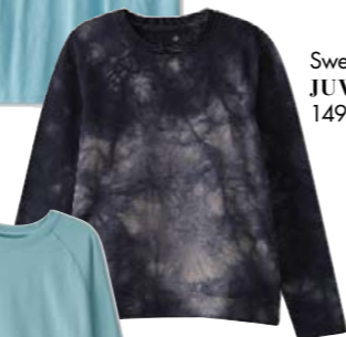
Sweatshirt JUVIA 149.90