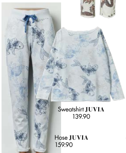
Sweatshirt JUVIA 139.90